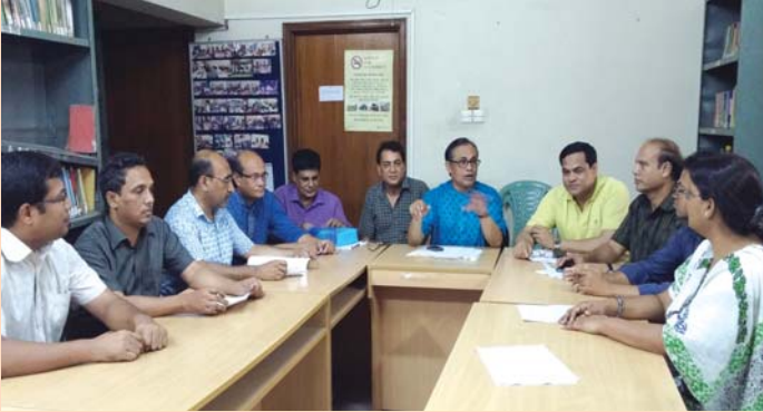
সেমিনার প্রস্তুতি সভায় বেলিড সদস্যবৃন্দ