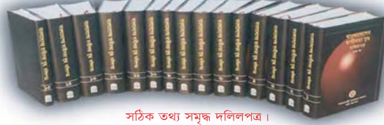
সঠিক তথ্য সমৃদ্ধ দলিলপত্র।

তথ্য মন্ত্রণালয়ের পক্ষে হাক্কানী পাবলিশার্স হতে প্রকাশিত।