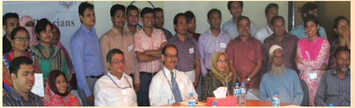
কর্মশালায় অংশগ্রহণকারী ও অতিথিবৃন্দ

ব্র্যাক বিশ্ববিদ্যালয়ের আয়েশা আবেদ লাইব্রেরি সম্প্রতি সিস্টেম লাইব্রেরির উপর দু’টি কর্মশালার আয়োজন করে। বিভিন্ন বিশ্ববিদ্যালয় এবং গবেষণা প্রতিষ্ঠানের ৪২ জন গ্রন্থাগার পেশাজীবীগণ এই কর্মশালায় অংশগ্রহণ করেন। বিশ্ববিদ্যালয় মঞ্জুরী কমিশন এবং বাংলাদেশ INASP PERI Consultium এর কর্মকর্তাবৃন্দ এই কর্মশালায় প্রতিনিধিত্ব করেন। দু’টি কর্মশালা দুই পর্বে অনুষ্ঠিত হয়। কর্মশালায় বিভিন্ন গ্রন্থাগার পদ্ধতি এবং হাতিয়ার এবং ওপেন সোর্স সফটওয়্যার এবং ওয়েব ডেভেলপমেন্ট টুলস সম্বন্ধে পরিচিতি প্রদান করা হয়।