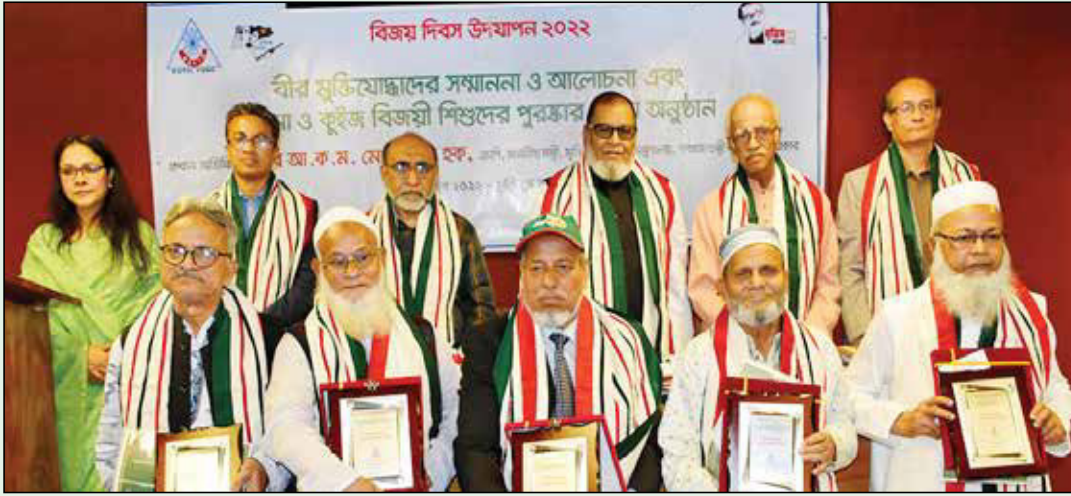
বীর মুক্তিযোদ্ধাদের সম্মাননা প্রদান