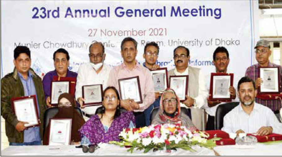
বেলিড সম্মাননা প্রাপ্ত গুণী ব্যক্তিবৃন্দ

বাংলাদেশ গ্রন্থাগারিক ও তথ্যায়নবিদ সমিতি (বেলিড)-এর ২৩তম সাধারণ সভা দেশের গ্রন্থাগারিকতা পেশার মান উন্নয়নে কৃতিত্ব পূর্ণ অবদানের জন্য ১১জন বিশিষ্ট ব্যক্তিকে 'বেলিড সম্মাননা' প্রদান করেছে। এ সকল গুণী ব্যক্তিদের নেতৃত্বে দেশের গ্রন্থাগার পেশাজীবীগণ ২০১৭ থেকে ২০২১ পর্যন্ত দীর্ঘ পাঁচবছর ধারাবাহিকভাবে রাজপথে আন্দোলন ও কর্তৃপক্ষের সাথে আলোচনার মাধ্যমে স্কুল, কলেজ, মাদ্রাসা ও কারিগরী শিক্ষাপ্রতিষ্ঠান গ্রন্থাগারিক ও সহকারী গ্রন্থাগারিকদের শিক্ষক পদমর্যাদা ও পদবী যথাক্রমে 'গ্রন্থাগার প্রভাষক' ও 'সহকারী শিক্ষক (গ্রন্থাগার ও তথ্য বিজ্ঞান)' গত ২৮ মার্চ ২০২১ তারিখের শিক্ষা মন্ত্রণালয়ের বেসরকারি শিক্ষাপ্রতিষ্ঠান (স্কুল ও কলেজ) জনবলকাঠামো ও এমপিও নীতিমালা ২০২১-এ অন্তর্ভুক্তির মাধ্যমে অর্জন করতে সক্ষম হয়েছেন। উলেখ্য, ২২