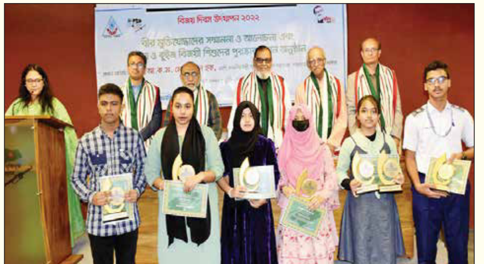
স্বাধীনতার সুবর্ণ জয়ন্তী উদযাপন উপলক্ষ্যে রচনা ও কুইজ প্রতিযোগিতায় অংশগ্রহণকারী বিজয়ী শিক্ষার্থীবৃন্দ

ঢাকার মুক্তিযুদ্ধ যাদুঘরের সেমিনার কক্ষে অনুষ্ঠিত ২ ডিসেম্বর ২০২২ তারিখে এক অনুষ্ঠানে গণপ্রজাতন্ত্রী বাংলাদেশ সরকারের মুক্তিযুদ্ধ বিষয়ক মন্ত্রণালয়ের মাননীয় মন্ত্রী এডভোকেট আলহাজ আ ক ম মোজাম্মেল হক, এমপি প্রধান অতিথি হিসেবে প্রতিযোগিতার বিজয়ী শিশুদের মাঝে পুরস্কার বিতরণ করেন। এ কুইজ ও রচনা প্রতিযোগিতায়