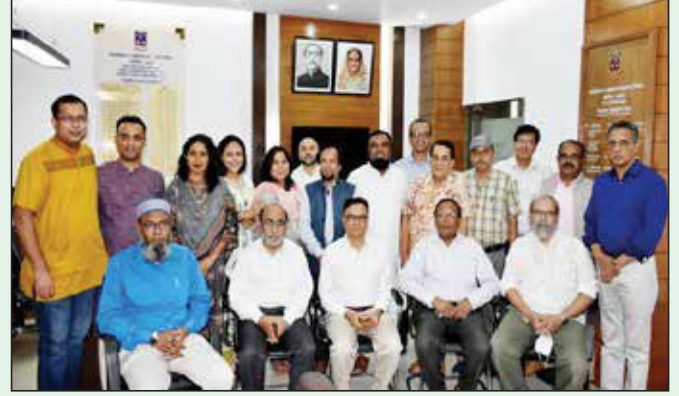
তথ্যবিজ্ঞান ও গ্রন্থাগার ব্যবস্থাপনা বিভাগ এলামনাই এসোসিয়েশন কার্যনির্বাহী কমিটির প্রথম সভায় উপস্থিত সদস্যবৃন্দ

ও গ্রন্থাগার ব্যবস্থাপনা বিভাগের সকল নিয়মিত শিক্ষার্থীরা ১৫০০ টাকা ফি প্রদান করে এই এলামনাই এসোসিয়েশনের সদস্য হতে পারবেন।