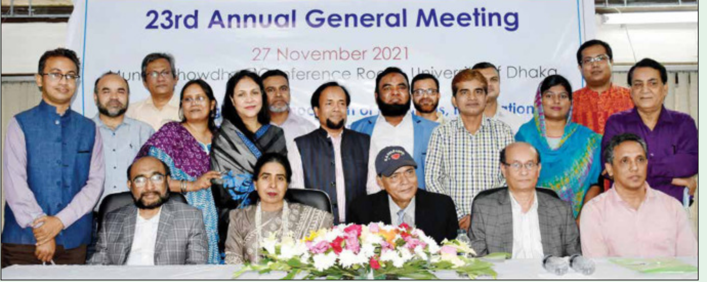
বেলিডের ২৩তম বার্ষিক সাধারণ সভায় নির্বাচিত কার্যনির্বাহী পরিষদ ২০২২-২০২৩

নির্বাচন কমিশনারগণ সভায় উপস্থিত সদস্যবৃন্দের মধ্যে থেকে বেলিডের কার্যনির্বাহী পরিষদের ১৭টি পদের যোগ্যপ্রার্থীর নাম আহ্বান করলে